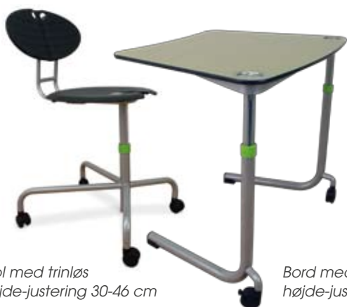
Stol med trinløs højdejustering 30-46 cm

De to hjul på up.grade® bordet gør det let og sjovt at indrette sig anderledes – igen og igen. Bordpladen kan fås i næsten hvilken som helst form og størrelse. Giver uanede muligheder. Eleverne giver gerne en hånd med... det er kun sjovt at trille rundt med sit eget lille up.grade® bord.