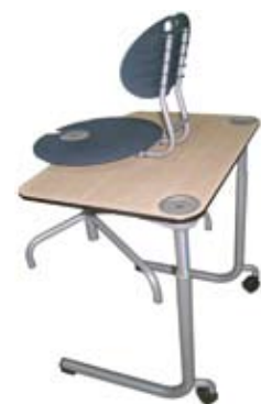
Stolen hænges let på bordet takket være skridsikre gummi-dupper