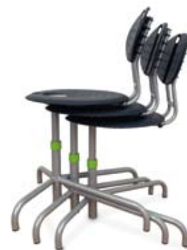
up.grade® stolene er nemme at stable